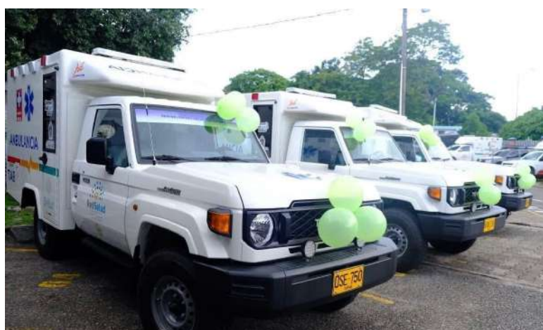
6 ambulancias nuevas y 2 vehículos de transporte especial, con una inversión de $2.359 millones.