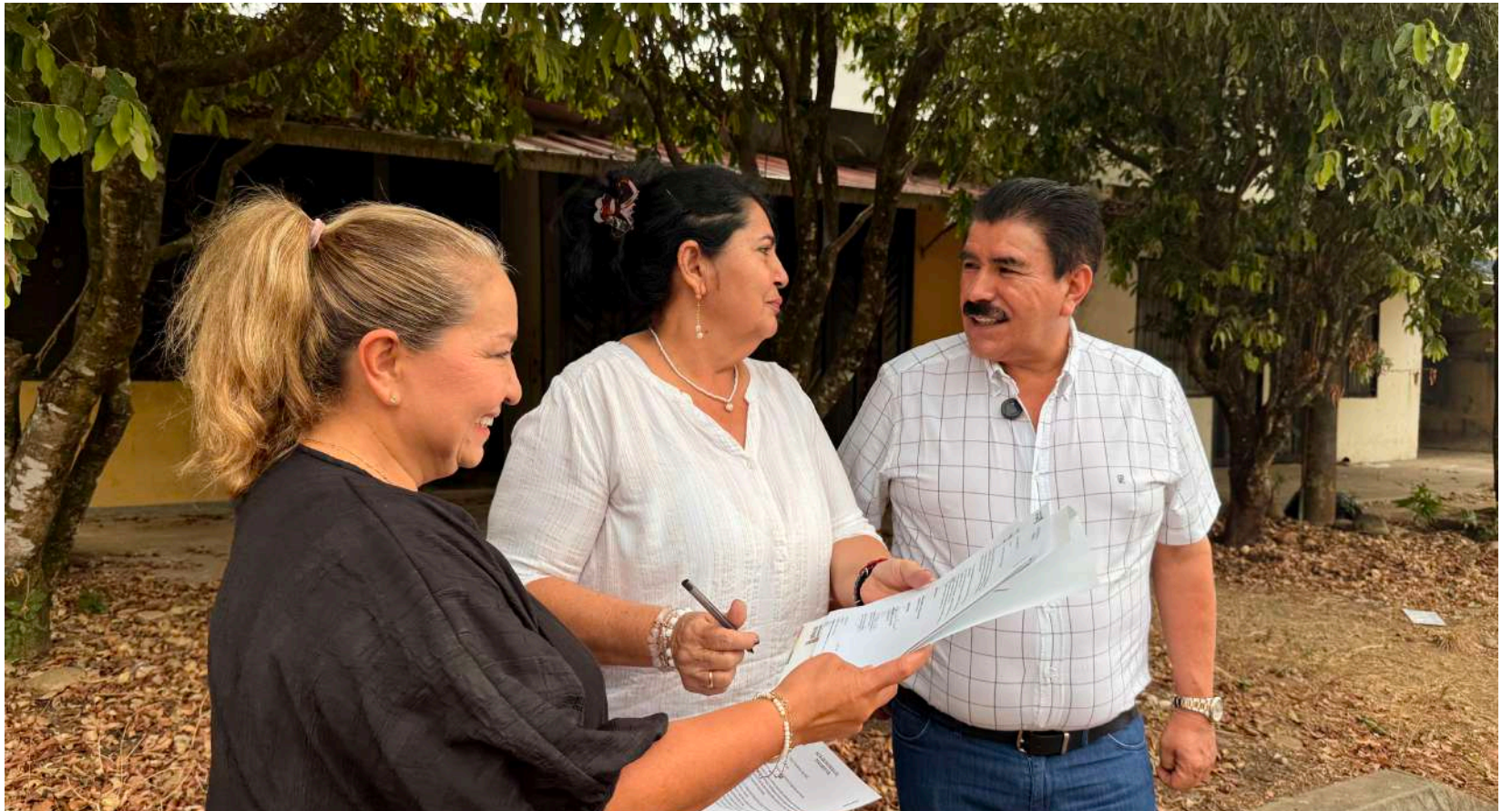
Orden territorial y proyectos para invertir.

La Secretaría de Planeación avanza en la consolidación de un territorio más organizado y con mayor seguridad jurídica. De forma paralela, se estructuraron y presentaron más de diez proyectos ante el Gobierno Nacional para su financiación a través del Sistema General de