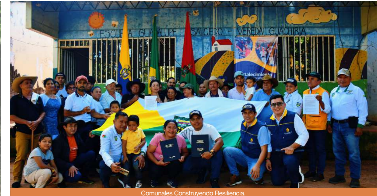
Comunales Construyendo Resiliencia.

espacio importante en Gestión del Riesgo Departamental, con la estrategia "Comunales Construyendo Resiliencia", de donde nació la implementación del Plan de Ayuda Mutua, que consiste en articular y fortalecer las capacidades de las comunidades, frente a una posible emergencia.