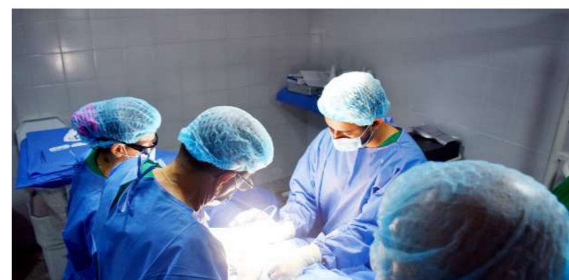
788 procedimientos quirúrgicos con el Hospital itinerante.

Este proyecto es liderado por la ESE Salud Yopal, cuenta con una inversión cercana a $23 mil millones y permitirá atender trastornos como depresión, ansiedad y consumo de sustancias psicoactivas en espacios especializados, des-