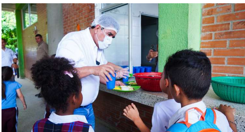
14.300 estudiantes beneficiados con el PAE.

Las obras avanzan, los colegios funcionan, el territorio se ordena y el campo recibe respaldo técnico. Las acciones ejecutadas en este inicio de 2026 reflejan una gestión articulada entre Secretarías y enfocada en resultados concretos. En Yopal, las buenas noticias se construyen con planificación, ejecución y una visión clara de ciudad, bajo un mismo propósito: Yopal para todos.