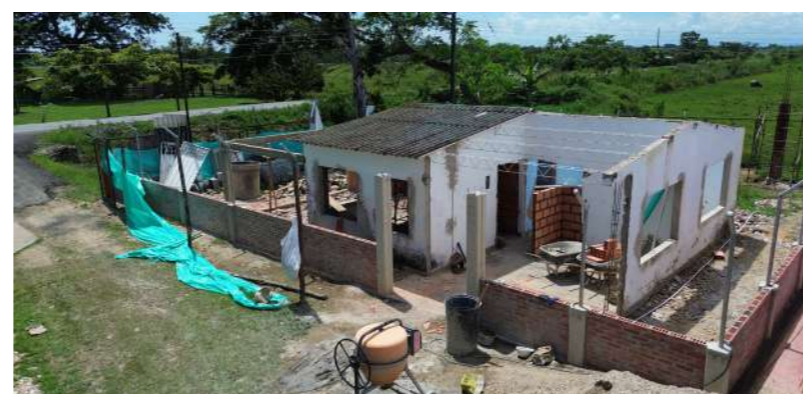
Reconstrucción de Puestos de Salud en Casanare.

Zorro dejará la mayor red de atención en salud en Casanare.