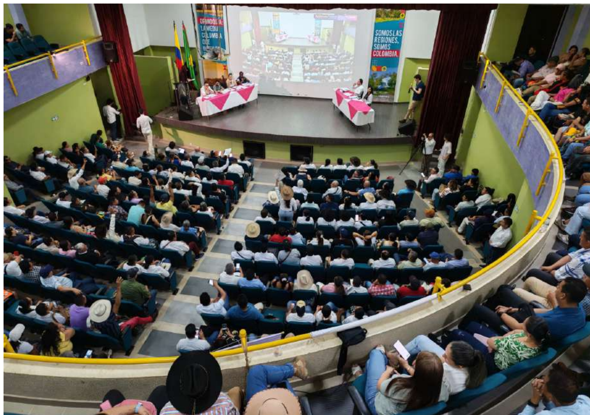
Convocó histórica audiencia pública en Casanare sobre extinción de dominio y tierras contó con la presencia de la SAE y entidades de control.

"Mi respaldo no es un cargo, es el trabajo realizado, las leyes impulsadas y los recursos gestionados".