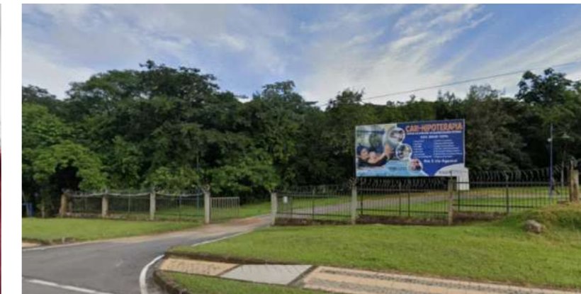
En el Centro de Hipoterapia se construirá el Hospital de Referencia en Salud Mental.

Zorro dejará la mayor red de atención en salud en Casanare.