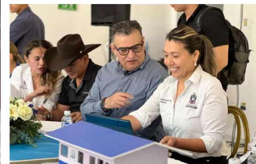
Hospital de Paz de Ariporo.