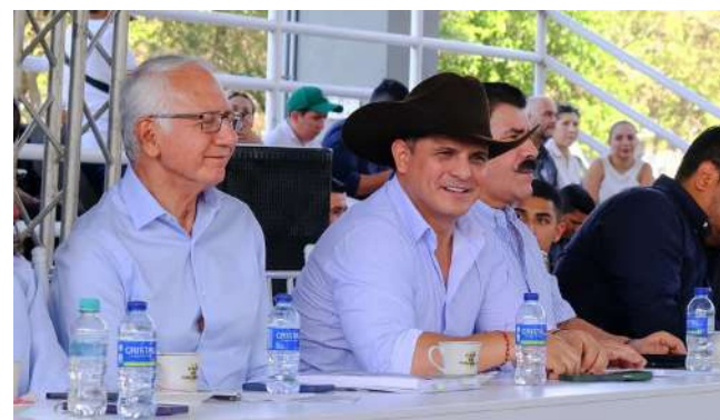
Respaldo decidido del ministro Guillermo Alfonso Jaramillo y la Presidencia de la República.