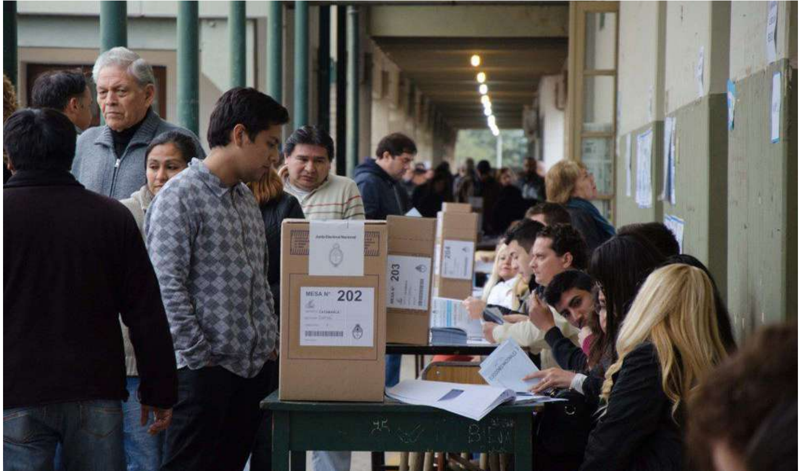
En 2022 la Participación fue del 48.75%.

Ambas corrientes lo aplican con matices distintos, agendas diferentes y enemigos propios, pero con una estructura sorprendentemente similar: Un pueblo virtuoso al que alguien le arrebató el futuro. Una élite