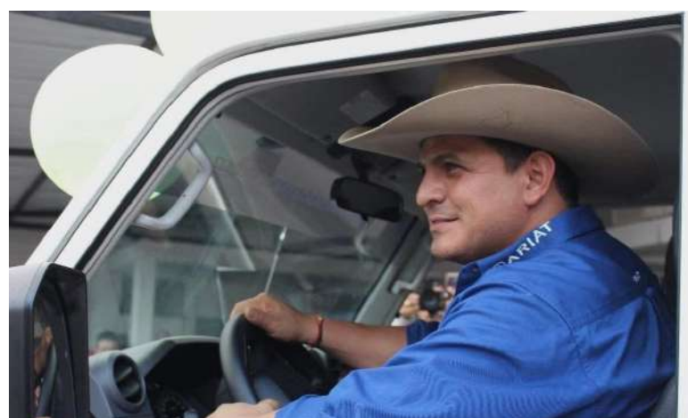
Casanare completa 22 ambulancias aportadas por el Gobierno Nacional.

especial, con una inversión de $2.359 millones, beneficiando a municipios como Orocué, Villanueva, Paz de Ariporo, Trinidad, Pore, Hato Corozal, San Luis de Palenque y Maní.