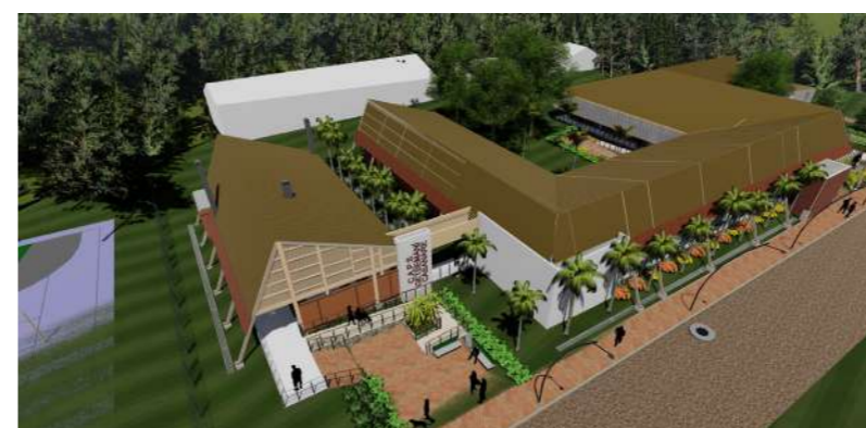
Comunidad indígena en Getsemani.

están culminando los estudios y diseños. Esta obra tendrá que ser resolutiva no sólo para Paz de Ariporo, sino para Chámeza, La Salina, Pore, Trinidad, San Luis, Hatocorozal y todo el norte de Casanare. Su inversión oscila entre los $52 mil millones.