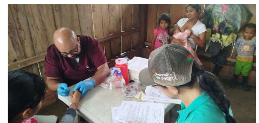
Una red fortalecida para atender comunidades indígenas.