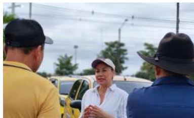
Reunión con líderes de transporte para tratar temas de la molécula de gas para el territorio y tarifa diferencial.

de recursos para el mejoramiento de las vías del Llano, con aportes del Ministerio de Hacienda, la Agencia Nacional de Infraestructura y el Inviás, así como el impulso a proyectos de conectividad vial y energética que buscan cerrar brechas históricas en la región.