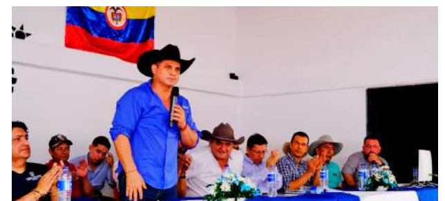
Gobernador César Ortiz y demás autoridades.

ciende a $37.302.185.890, financiados con recursos del Sistema General de Regalías. El municipio de Tauramena aporta $23.151.092.945 y la Gobernación de Casanare $14.151.092.945.