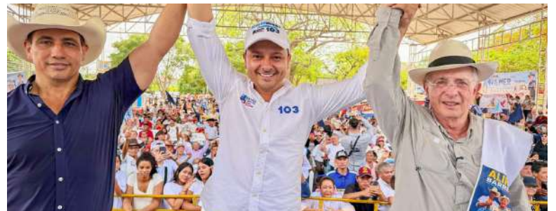
Paz de Ariporo.

En educación, plantea convertir a Casanare en un “Departamento Universitario”, propone modificar el Sistema General de Regalías para que el 20% de