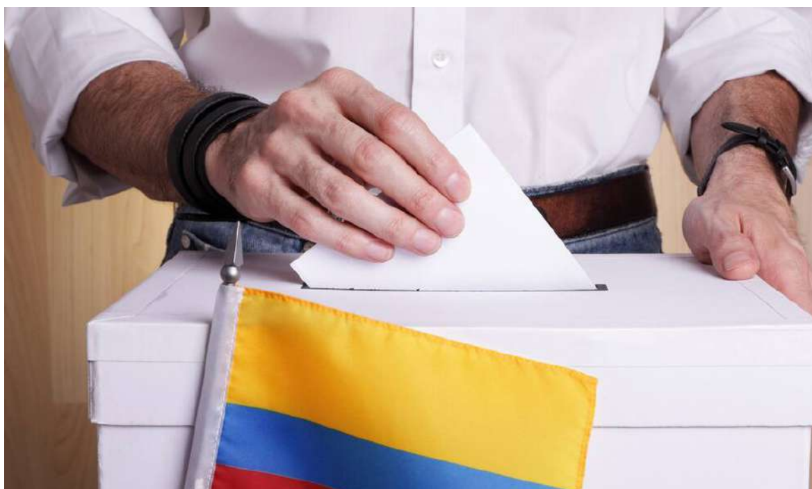
En 2022 la abtención fue del 51.25%.

El problema pasa a ser cuánto tiempo más el sistema democrático puede seguir siendo aceptado como el árbitro legítimo del conflicto político nacional.