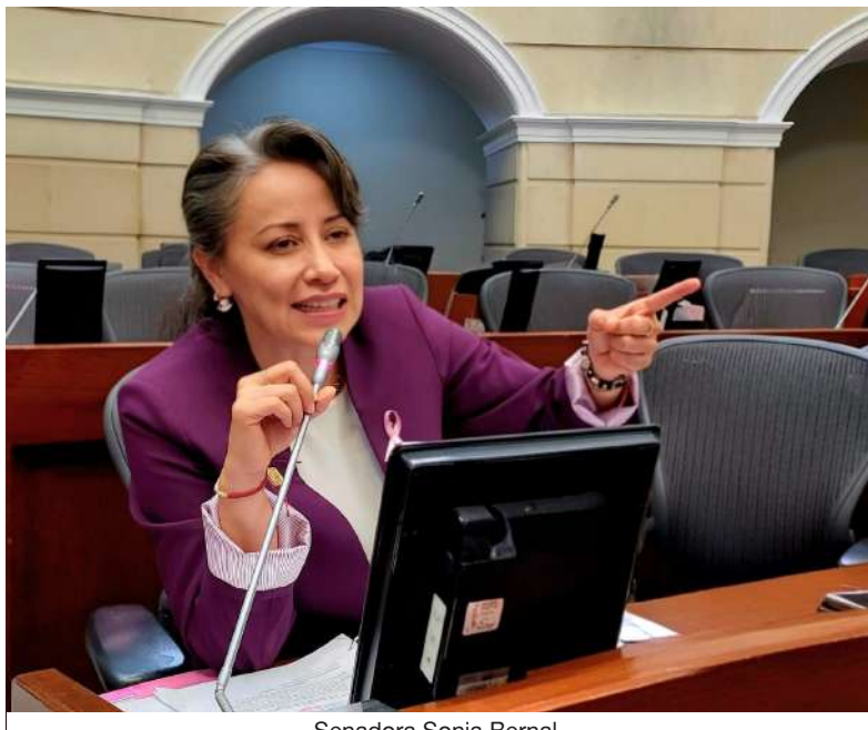
Senadora Sonia Bernal.

Durante su paso por el Congreso también acompañó la asignación