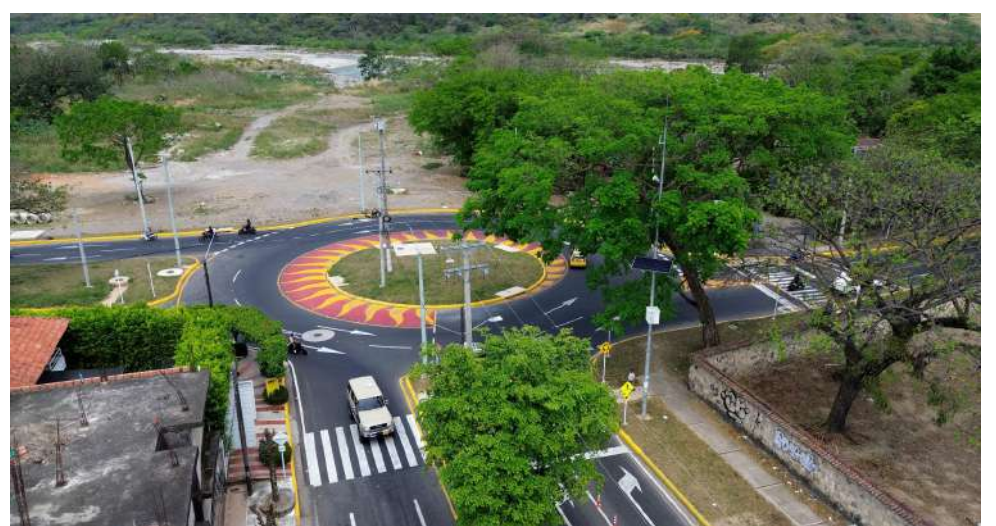
Glorieta en la carrera 29.