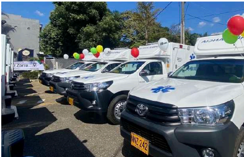
22 ambulancias, una fluvial y otra aérea.

Nunca antes en la historia de Casanare un mandatario había asumido con tanta determinación el reto de transformar el sistema de salud del departamento. César Ortiz Zorro se consolida como el gobernador que más ha invertido y gestionado recursos ante el Gobierno Nacional para reivindicar el derecho de los casanareños a una atención digna y oportuna.