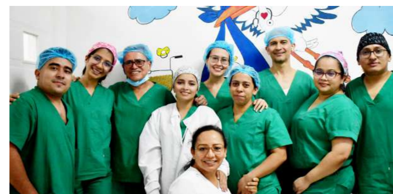
556 equipos APS entre 2024 - 2025 y 2026.