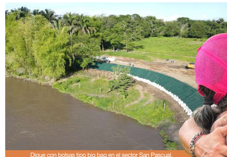
Dique con bolsas tipo big bag en el sector San Pascual.