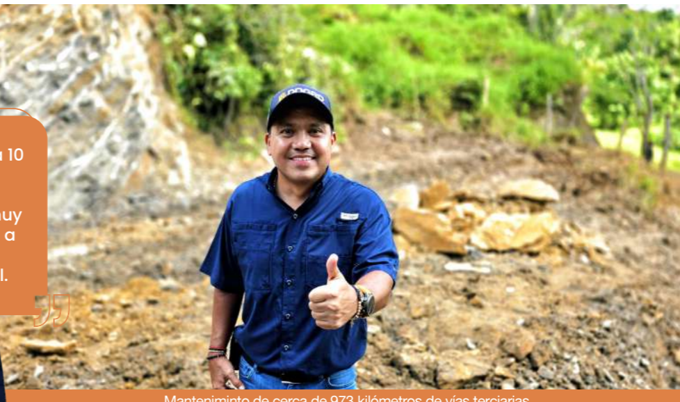
Mantenimiento de cerca de 973 kilómetros de vías terciarias.