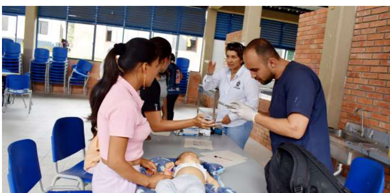
42.000 atenciones en salud en 23 jornadas del Hospital Itinerante.

“Pese a la crisis nacional del sistema, Casanare avanza en la consolidación de una red más fuerte, preventiva y resolutiva, gracias a nuestras gestiones y al excelente equipo liderado desde la Secretaría de Salud departamental”, señaló César Ortiz Zorro, gobernador.