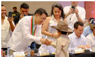
Cumbre internacional Orinoquia - China, donde empresarios de la región lograron acuerdos comerciales con empresas de ese país.