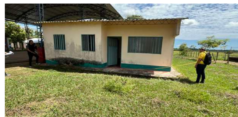
80 proyectos para mejorar puestos de Atención Primaria en Salud.