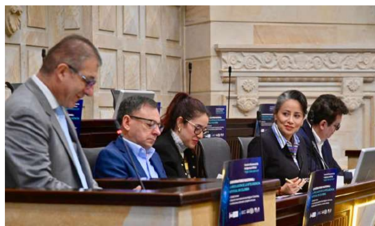
Última sesión de la Comisión de Inteligencia Artificial, en debate a las normas regulatorias de la IA en Colombia.