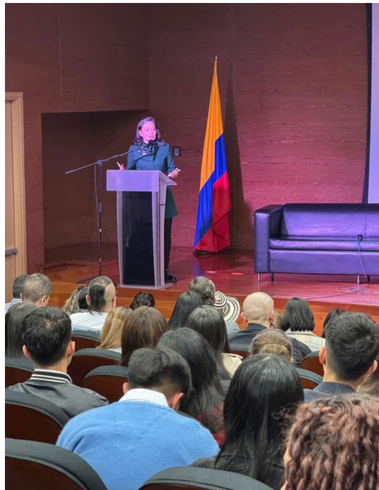
30 de julio 2025, en el marco del Día Mundial Contra La Trata, La senadora realizó el conversatorio "Trata de Personas Un delito silencioso".

Su trabajo incluyó además el liderazgo de la regulación de la Inteligencia Artificial con enfoque