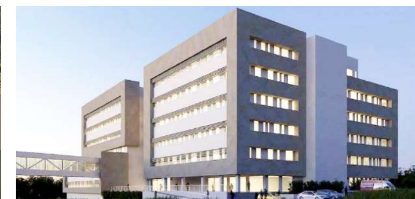
Hospital de Alta Complejidad.