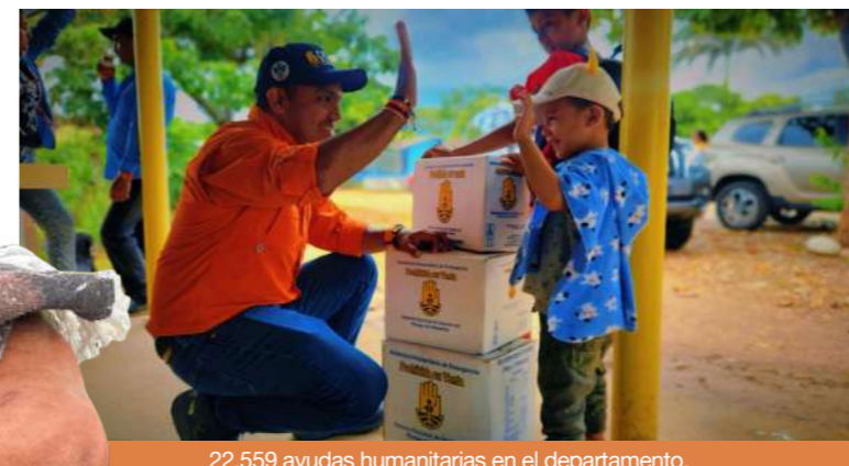
22.559 ayudas humanitarias en el departamento.

estrategia "Jóvenes Unidos por un Futuro Resiliente", donde ya hacen parte un grupo importantes de líderes juveniles, con quienes crearon la Red Departamental de Jóvenes para la Reducción del Riesgo de Desastres, la primera en el país, que se unirá a la Red Nacional.