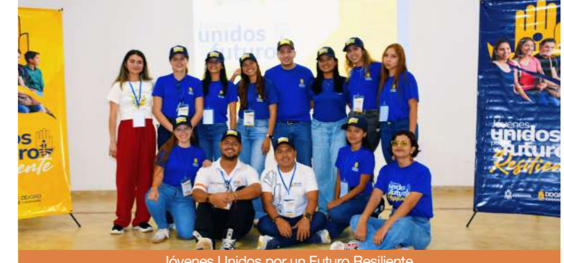
Jóvenes Unidos por un Futuro Resiliente.

En Yopal, el trabajo articulado entre instituciones, sector privado y comunidad, permitió la construcción de un dique con bolsas tipo big bag en el sector San Pascual, protegiendo a cerca de 500 familias de las inundaciones del