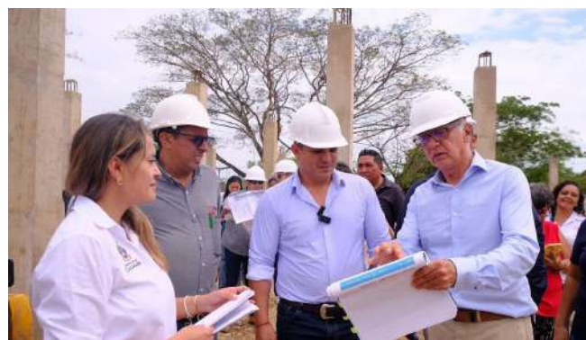
Más de 80 Puestos de Atención Primaria en Salud (PAPS).

Este ambicioso plan, respaldado por el ministro Guillermo Alfonso Jaramillo y la Presidencia de la República, refleja una apuesta decidida por la vida, la equidad y el bienestar de todos los casanareños, consolidando a Casanare como referente nacional en inversión y gestión en salud.