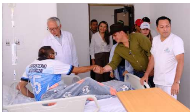
Más de 1.500 profesionales de la salud recorren finca a finca los 19 municipios del departamento.