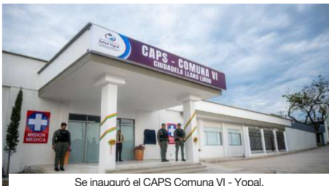
Se inauguró el CAPS Comuna VI - Yopal.