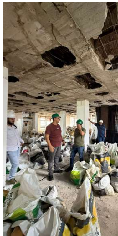
El proyecto SIRS ya alcanza el 48% de ejecución en 2025.

Están conectadas por más de 120 km de fibra óptica, funcionan sin depender de internet y resisten lluvia, polvo y vandalismo, incluso en zonas rurales. Ante cualquier alerta, envían la información en tiempo real al Centro Integrado de Seguridad de la Gobernación de Casanare, permitiendo una respuesta rápida y segura. “No son solo cámaras: son sistemas inteligentes que cuidan a la gente en tiempo real”, señaló el gobernador César Ortiz Zorro.