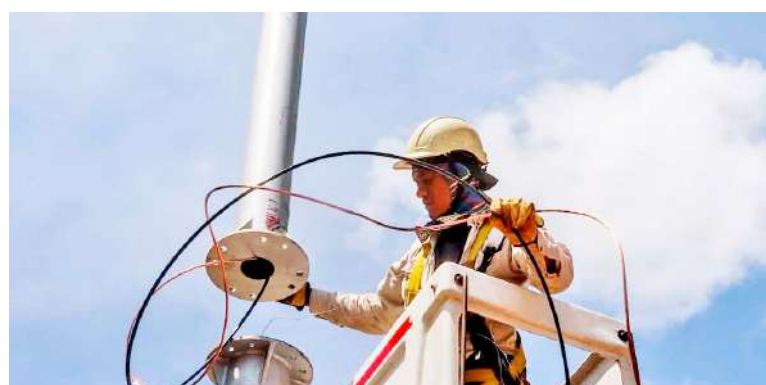
PAZ DE ARIPORO: 40 cámaras y 11 km de fibra óptica, la nueva vigilancia inteligente del municipio.