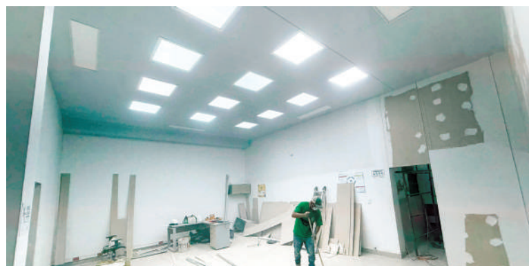
PAZ DE ARIPORO: Convenio interadministrativo convierte al municipio en referente tecnológico de seguridad ciudadana.