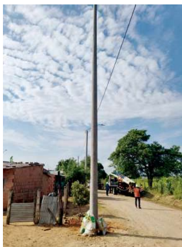
230 cámaras, 100 bocinas a instalar.

ción de cámaras de seguridad avanzadas, bocinas para alertas comunitarias, más de 120 kilómetros de fibra óptica y la puesta en funcionamiento de un Centro Integrado de Seguridad dentro de la Gobernación de Casanare, con salas de coordinación, monitoreo y atención de situaciones especiales.