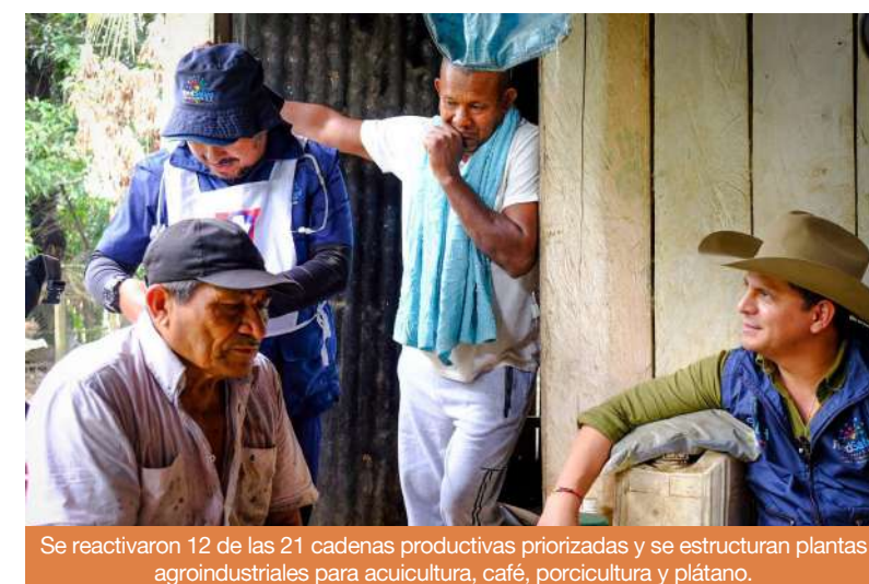
Se reactivaron 12 de las 21 cadenas productivas prioritizadas y se estructuran plantas agroindustriales para acuicultura, café, porcicultura y plátano.

En el frente agroindustrial, Casanare avanzó en innovación rural y fortalecimiento productivo. Se reactivaron 12 de las 21 cadenas productivas prioritizadas y se estructuran plantas agroindustriales para acuicultura, café, porcicultura y plátano, que iniciarán operaciones en 2026. En cacao, 340 familias reciben inversiones superiores a 19 mil millones de pesos, mientras más de 600 familias productoras fueron impulsadas con maquinaria, insumos y acompañamiento técnico.