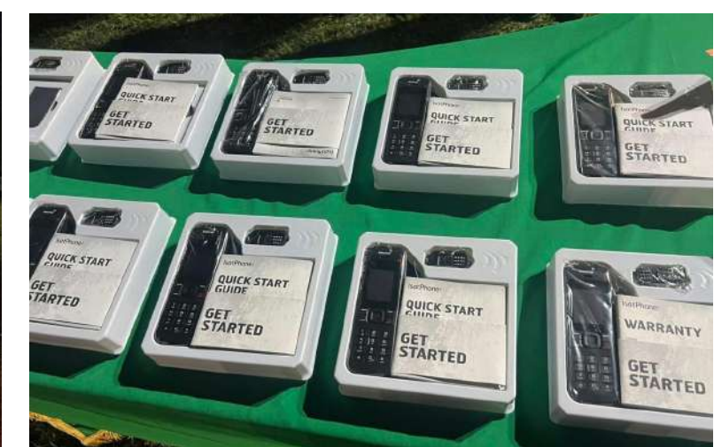
Gobernación de Casanare consolida un ecosistema tecnológico de seguridad con más de $50 mil millones invertidos.