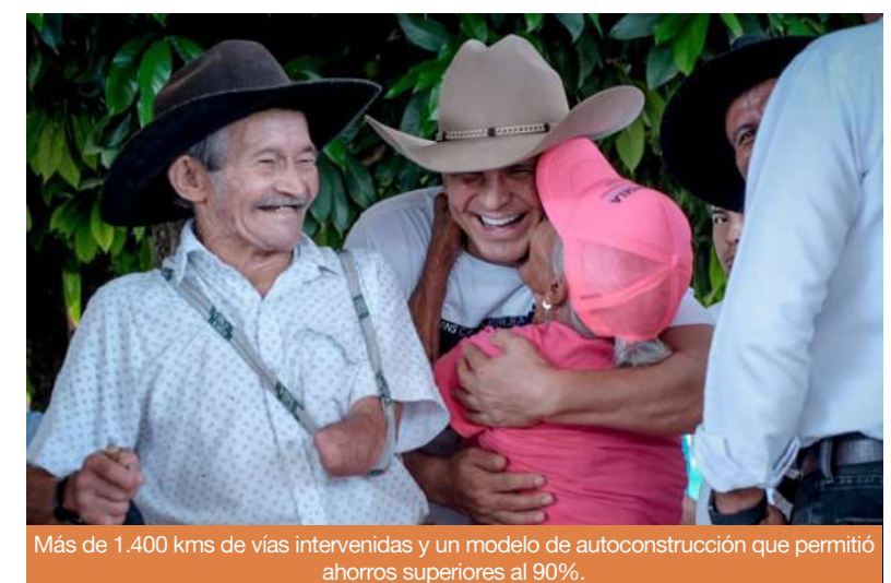
Más de 1.400 kms de vías intervenidas y un modelo de autoconstrucción que permitió ahorros superiores al 90%.

Finalmente, más de 100 mil personas fueron beneficiadas directamente con programas sociales, jornadas solidarias y acciones humanitarias impulsadas desde el Gobierno departamental. 30.000 regalos llegaron a niños y niñas de zonas apartadas, más de 6.000 pañales fueron entregados a recién nacidos en Yopal y 1.200 paquetes nutricionales se destinaron a bebés con bajo peso y madres gestantes. En Bogotá, el Hogar Mi Casa-nare ha brindado hospedaje gratuito a más de 500 familias casanareñas que requieren atención médica, mientras se entregaron más de 800 ayudas técnicas, 16.950 mercados para adultos mayores y 80.000 unidades de bienestarina, cifras que dimensionan el alcance real de más de 500 logros ejecutados por el gobierno de César Ortiz Zorro en los 19 municipios de Casanare.