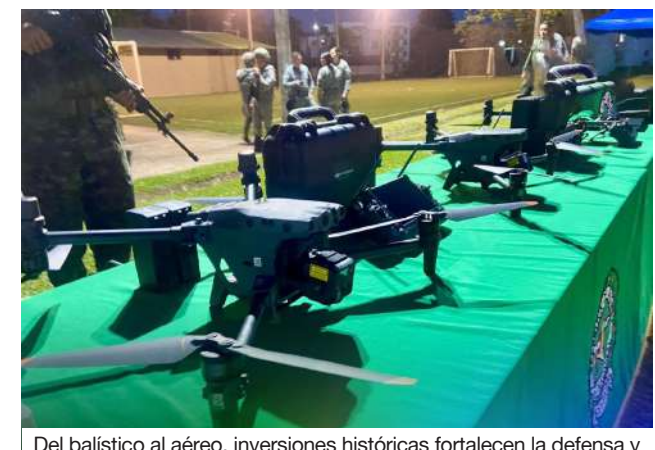
Del balístico al aéreo, inversiones históricas fortalecen la defensa y convivencia en el departamento.