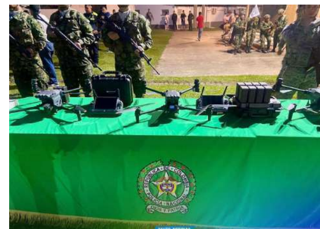
2025 el año de la transformación tecnológica.