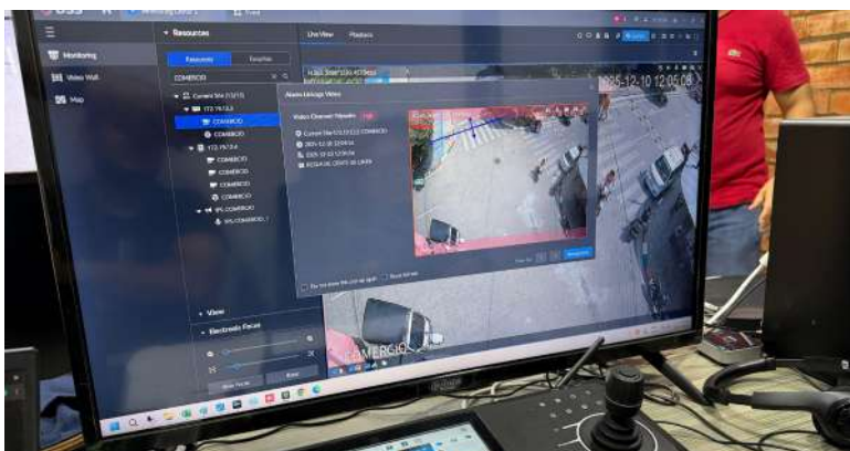
TRINIDAD: Modernos equipos conectados con el entorno en tiempo real.