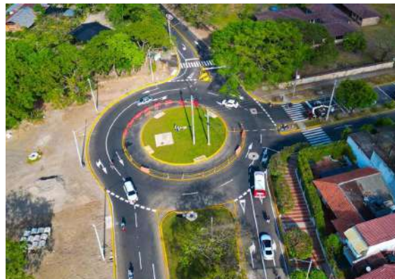
Glorieta carrera 29 en la ciudad.