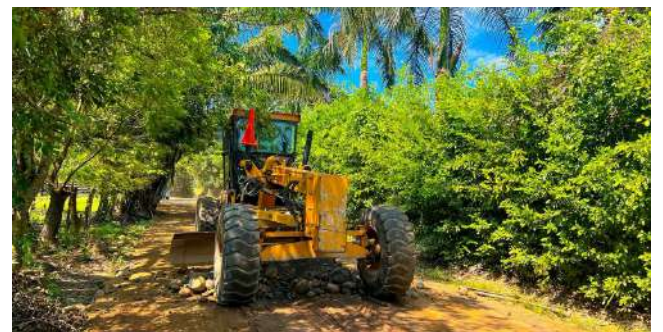
Mantenimiento de vías terciarias.