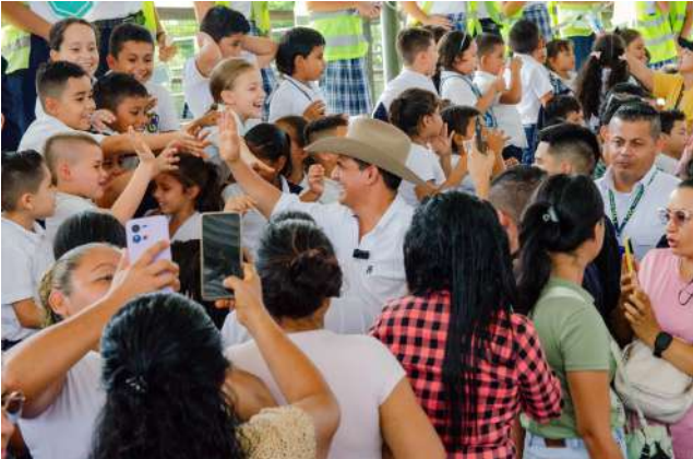
Más de 30.000 estudiantes cuentan con servicio de internet.

de 30.000 estudiantes cuentan con servicio de internet con una inversión de $960 millones, alcanzando 318 sedes educativas en articulación con Centros Digitales. La educación inclusiva benefició a cerca de 1.000 estudiantes con discapacidad o talentos excepcionales, con más de $700 millones, y se fortalecieron la etnoeducación, el Sistema de Educación Indígena Propio y la Cátedra de Afrocolombianidad.