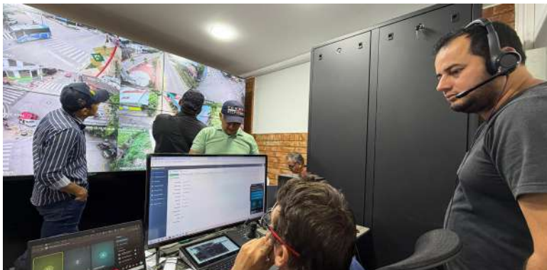
Cámaras con reconocimiento facial, fibra óptica y respaldo energético. Trinidad ya tiene su propio SIES.