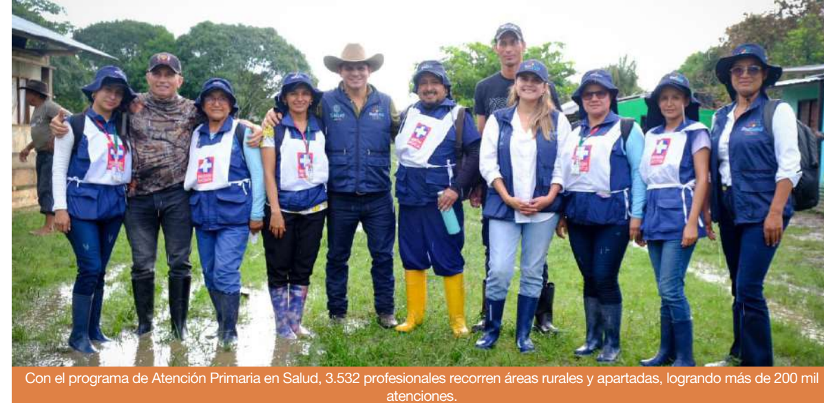
Con el programa de Atención Primaria en Salud, 3.532 profesionales recorren áreas rurales y apartadas, logrando más de 200 mil atenciones.

Más de 100 mil personas fueron beneficiadas directamente con programas sociales.