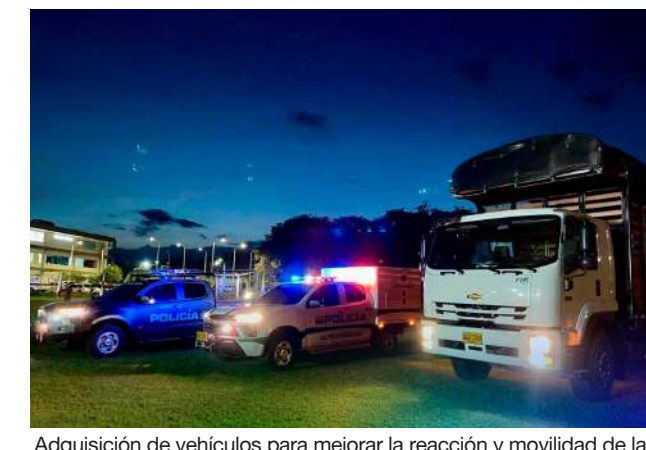
Adquisición de vehículos para mejorar la reacción y movilidad de las fuerzas de seguridad.