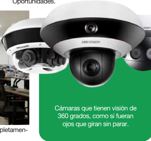
Cámaras que tienen visión de 360 grados, como si fueran ojos que giran sin parar.