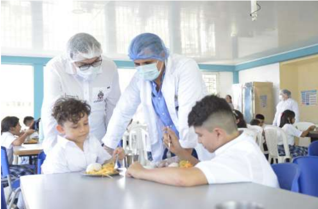
El PAE benefició a más de 15.000 estudiantes en 433 sedes.

La estrategia Educación en Territorio fortaleció la gestión institucional mediante encuentros municipa-