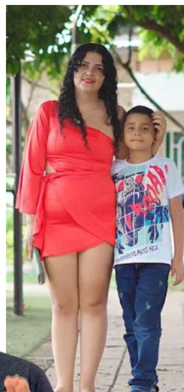
El autismo en Casanare tendrá su política pública.

teracción social y el comportamiento. Sin intervención temprana y apoyos adecuados, estas dificultades pueden profundizarse y convertirse en barreras permanentes en el entorno escolar, social y familiar.