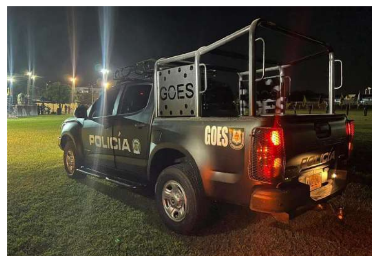
Vehículos para mejorar la reacción y movilidad.

Estas inversiones adicionales suman más de $10.000.000.000, que al integrarse con los $40.000 millones del convenio interadministrativo entre FONSECON y la Gobernación, arrojan un total de más de 50 mil millones de pesos invertidos en tecnología de seguridad en 2025.