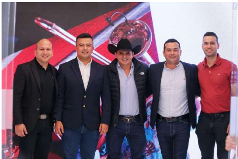
La seguridad y la convivencia ciudadana se convierten en pilares del Gobierno de las Oportunidades.

La iniciativa contempla la modernización y ampliación de la