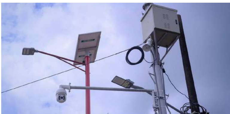
TRINIDAD: Gobernación de Casanare convierte a Trinidad en referente tecnológico en seguridad ciudadana.