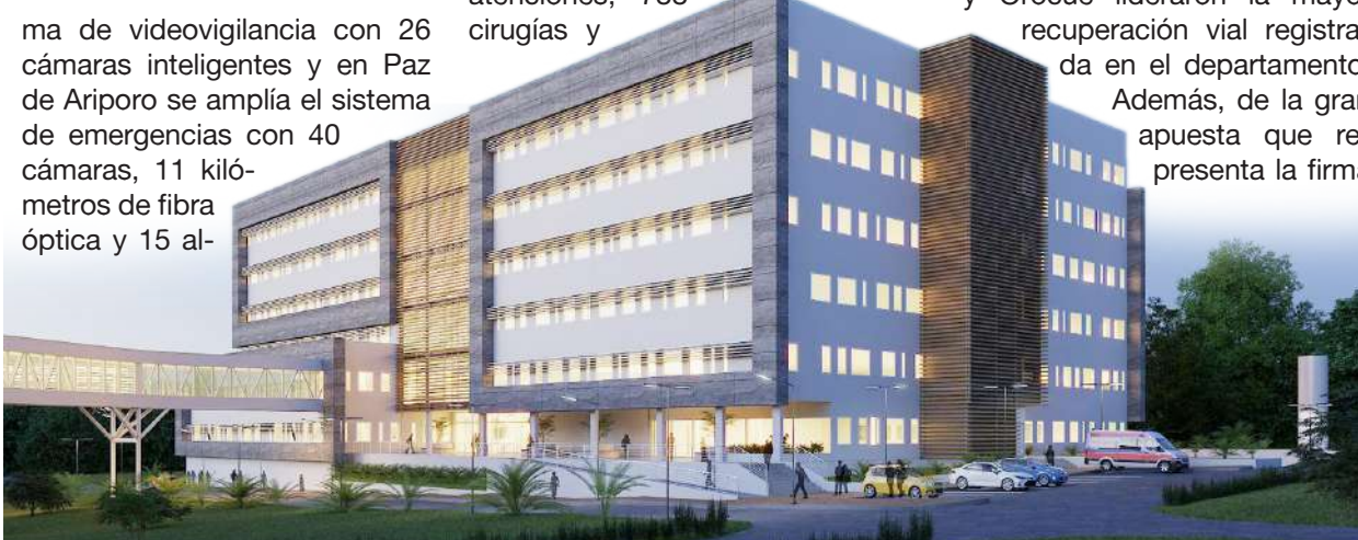
El Hospital de Alta Complejidad ya cuenta con estudios aprobados y una gestión superior a 100 mil millones de pesos ante el Gobierno Nacional.

En materia de seguridad, el informe evidenció una transformación liderada directamente por el gobernador. Durante el 2025 se inició la construcción del sistema tecnológico más moderno en la historia del departamento, con cámaras inteligentes, drones, tecnología satelital, vehículos tácticos y plataformas judiciales que fortalecen la capacidad de respuesta, especialmente en Yopal. En Trinidad se modernizó el siste-