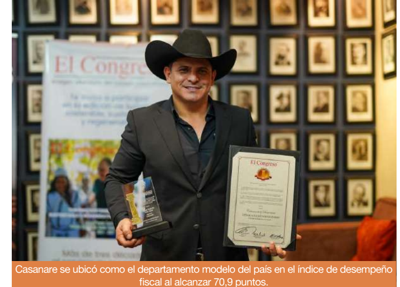
Casanare se ubicó como el departamento modelo del país en el índice de desempeño fiscal al alcanzar 70,9 puntos.