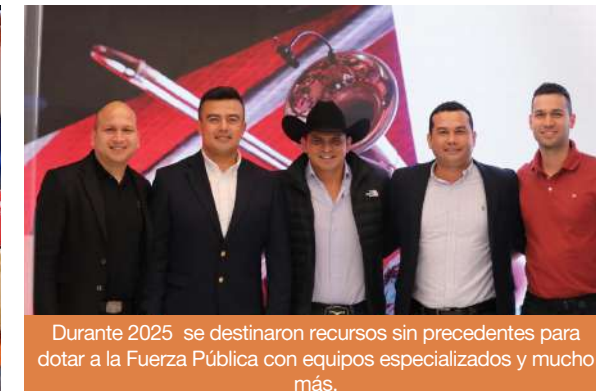
Durante 2025 se destinaron recursos sin precedentes para dotar a la Fuerza Pública con equipos especializados y mucho más.

hasta un parto atendido en sitio. Además, 16 municipios fortalecieron su conectividad en salud con ambulancias nuevas y avanzan proyectos como el Hospital de Maní y los CAPS de Getsemaní en el resguardo Caño Mochuelo, que beneficiará a 12 comunidades indígenas.