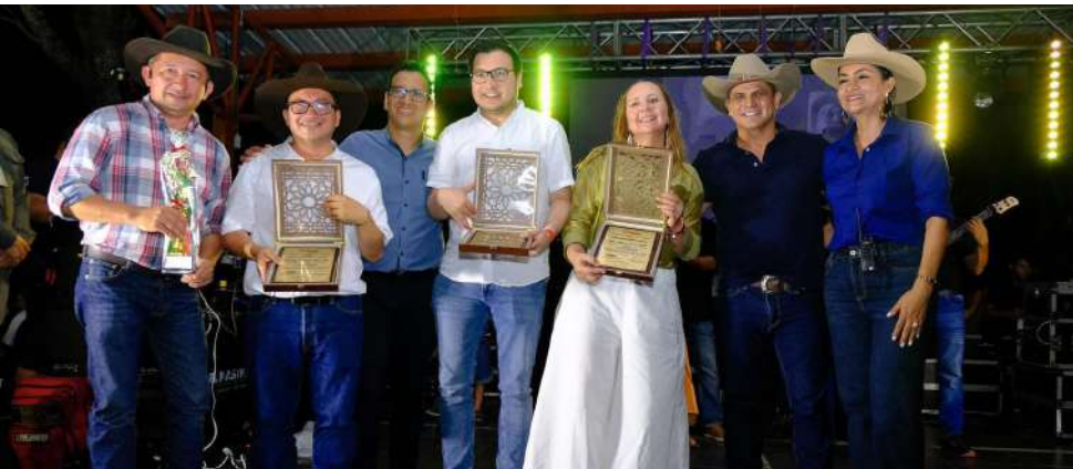
Los juegos interdocentes fueron un éxito en el 2025.

El sector educación destacó en el Índice Departamental de Competitividad 2025, Casanare fue anfitrión del Encuentro Regional de Secretarías de Educación, aportó al Plan Nacional Decenal de Educación 2026-2035, realizó la Jornada Interdocentes con cerca de 3.000 maestros, e inició la Gran Matriculación, con matrículas abiertas para 2026 en todas las instituciones educativas del departamento.