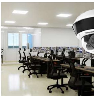
35 puestos de monitoreo completamente equipados.