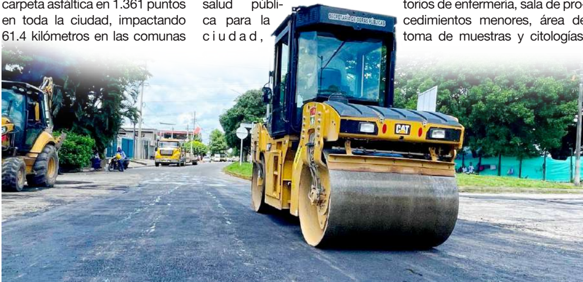
Mantenimiento de vías urbanas en Yopal.

Este centro de salud, desarrollado en un nivel, garantizará atención oportuna y accesible para la comunidad, contando con la capacidad instalada para la prestación de servicios entre otros, consultorios médicos, consultorios odontológicos, consultorio de vacunación, consultorios de enfermería, sala de procedimientos menores, área de toma de muestras y citologías,