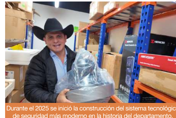
Durante el 2025 se inició la construcción del sistema tecnológico de seguridad más moderno en la historia del departamento.