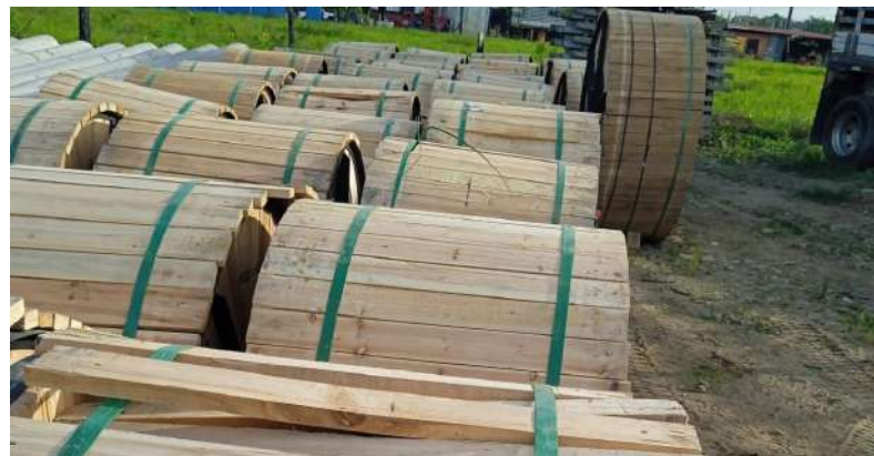
120 km de fibra óptica, la tecnología que vigila Casanare.