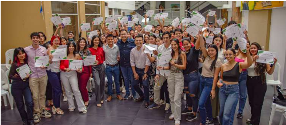
El programa Casanare Joven apoyó a 220 estudiantes.