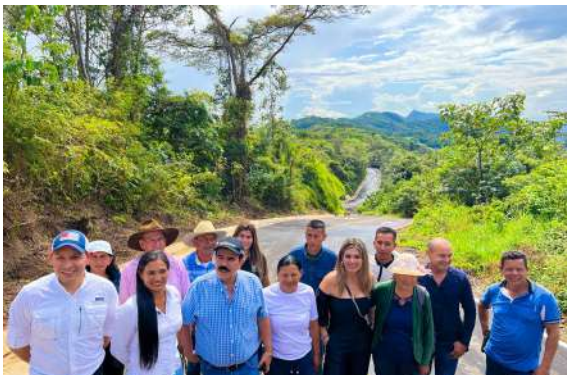
Alcalde Marco Tulio Ruíz revisa obras de pavimentación de importantes vías rurales.