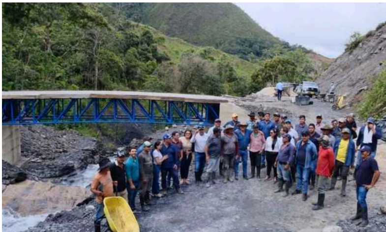
Con una inversión cercana a $8.000 millones de pesos se ejecutaron obras valoradas en más de $88.000 millones.

en el índice de desempeño fiscal al alcanzar 70,9 puntos, muy por encima del promedio nacional de 53,46 puntos, lo que refleja altos niveles de ejecución y recaudo, así como la capacidad de hacer rendir los recursos a pesar de las adversidades y los bloqueos institucionales. En ese balance, el mandatario destaca el trabajo de su equipo y el enfoque gerencial que ha guiado la gestión.