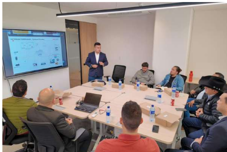
$40 mil millones para proteger a Yopal, la inversión histórica que transforma la seguridad ciudadana.

El proyecto de seguridad financiado con regalías incluye