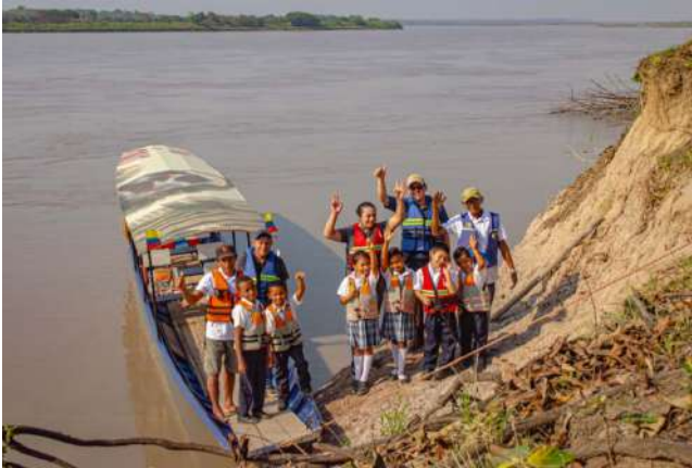
Transporte Escolar para 6 mil estudiantes en 327 Rutas.

les. Por Obras por Impuestos, se viabilizaron $5.800 millones para dotaciones en Hato Corozal y La Salina, y se avanzó en nuevos proyectos para otros muni-