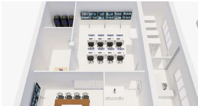
PAZ DE ARIPORO: $2.450 millones blindan la seguridad de Paz de Ariporo.

El proyecto contempla la instalación de 40 cámaras en 22 puntos estratégicos, que son 19 cámaras PTZ de