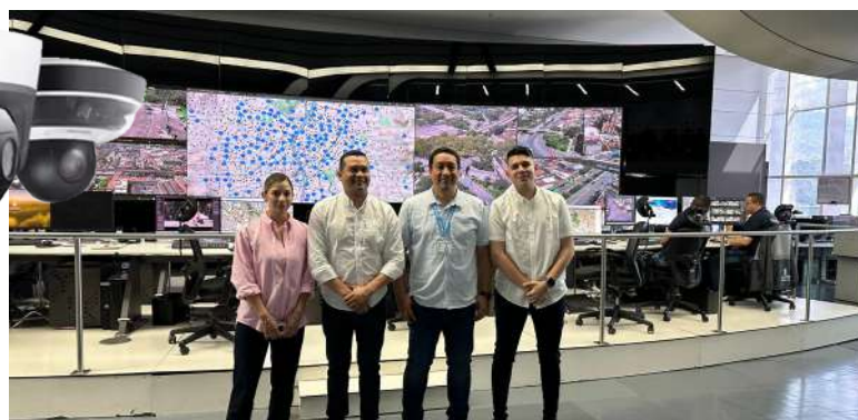
De Medellín a Yopal, la tecnología de vigilancia que fortalece la convivencia ciudadana en Colombia.

mantenimiento integral por 24 meses (soporte técnico, monitoreo, actualizaciones, reparación de equipos y capacitación), con un 48 % de ejecución a diciembre de 2025, consolida a Casanare como referente nacional en vigilancia, capacidad de respuesta y confianza ciudadana, bajo control institucional de la Gobernación.