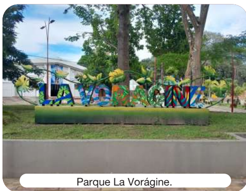
Parque La Vorágine.