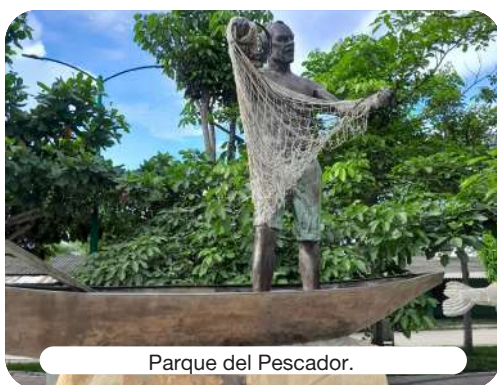
Parque del Pescador.