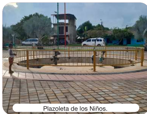
Plazoleta de los Niños.