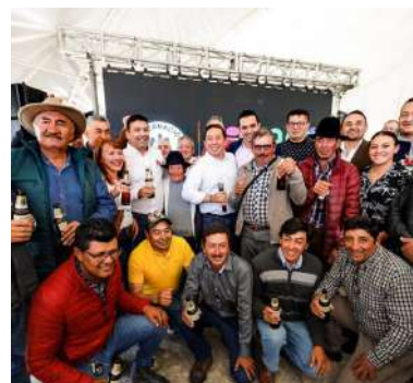
Productores de cebada en Boyacá.

El Gobierno de Boyacá, trabajando en equipo con el Ministerio de Agricultura y Bavaria, construirá la primera