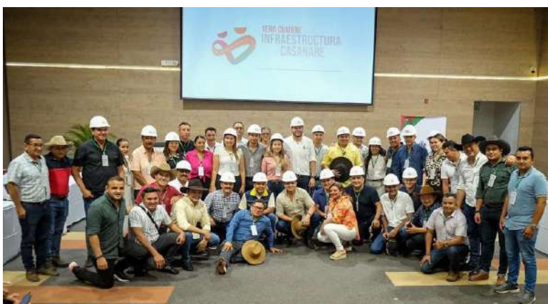
19 Secretarías de Infraestructura unidas en un mismo propósito