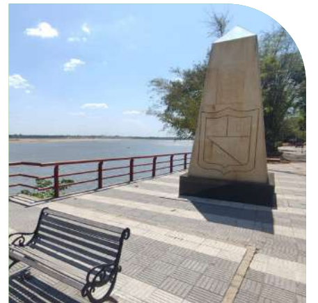
Obelisco en el Malecón.