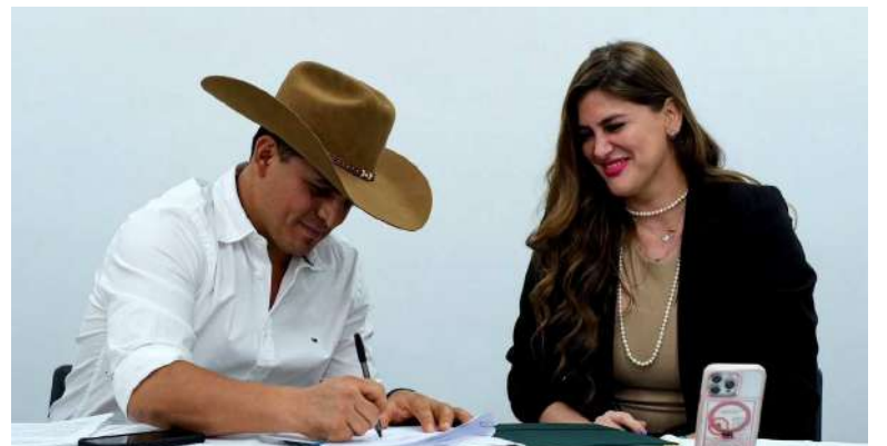
Casanare hace parte del Parlamento Andino