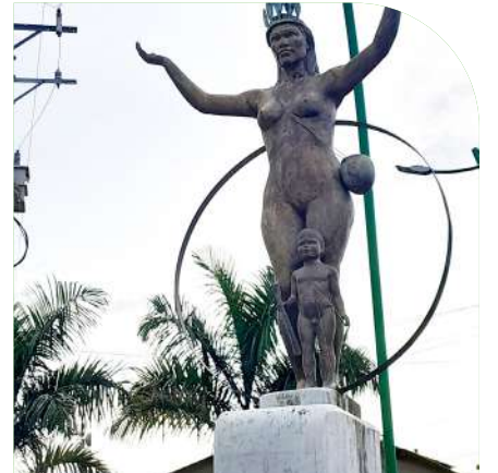
Parque de la Mujer Indígena.