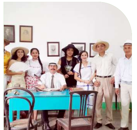
Casa Museo de La Vorágine.