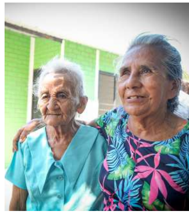
“Las Marías” en Bocas del Pauto

materia de salud y atención a la población del campo.