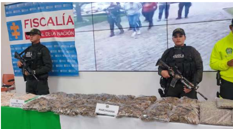
Gran decomiso de droga ilícita en Casanare

Volvieron las jornadas médicas especializadas al campo. En el corregimiento El Convento a dos horas de Trinidad se realizó la primera jornada médica con servicios especializados que benefició a 1.200 casanareños de 8 veredas. Uno de los compromisos más importantes de Zorro en