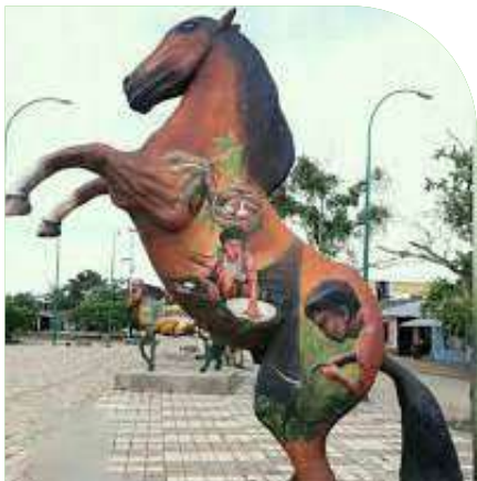
Parque Los Caballos.