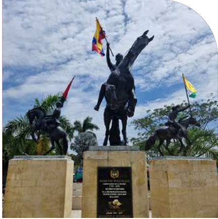
Monumento El Bicentenario.