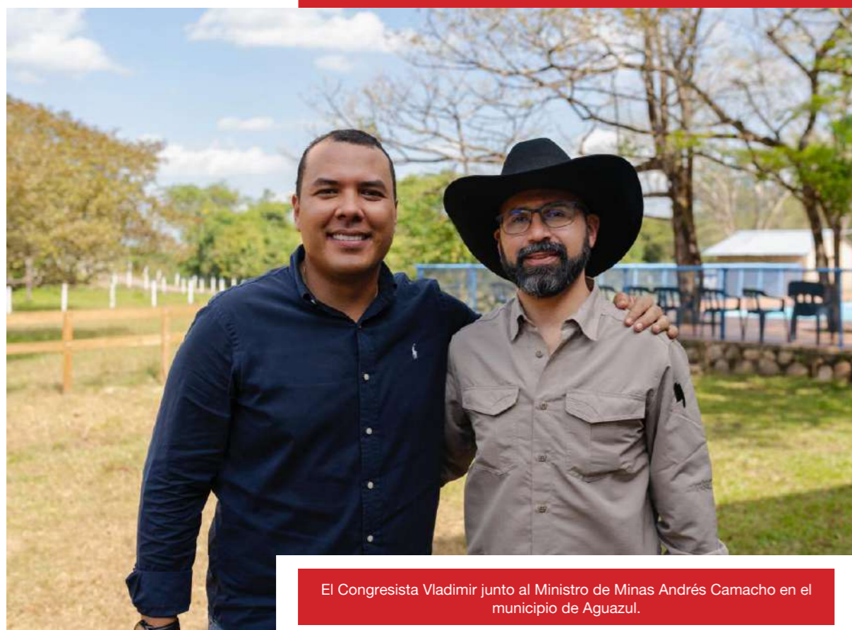
El congresista Vladimir junto al Ministro de Minas Andrés Camacho en el municipio de Aguazul.

• Transformación productiva y acción climática a través de la creación de la Planta de Urea. En este punto vale la pena destacar que en diciembre de 2023 estuvo el Ministro de Minas Andrés Camacho en Aguazul, en una audiencia pública promovida por el representante Vladimir Olaya y desde este territorio de Casanare, el alto funcionario del Gobierno Petro, anunció que este año iniciarían los estudios de factibilidad para la Planta de Urea en Casanare.