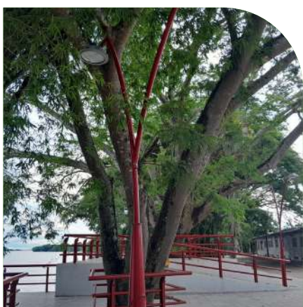
Árbol de Caracaro o Árbol del Amor.