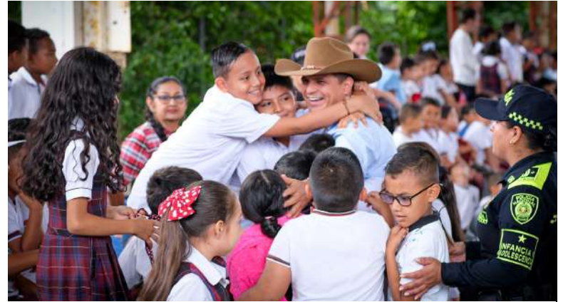
Expresiones de amor hacia el gobernador

Más de 100 mil niños y niñas recibieron kits escolares para su inicio de clases. Útiles recolectados a través de DonaKits, estrategia de la Gobernación de