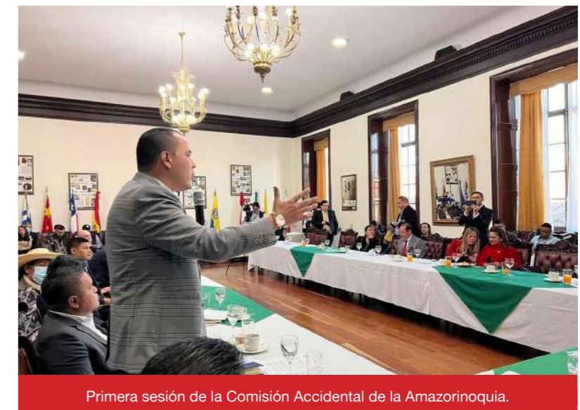
Primera sesión de la Comisión Accidental de la Amazorinoquia.

• Titulación de tierras. "Casanare es uno de los departamentos con menos formalización de sus tierras en el país. Esto se convierte en un gran problema porque el estado no puede hacer ningún tipo de inversión, es decir, los campesinos y agricultores no pueden ac-