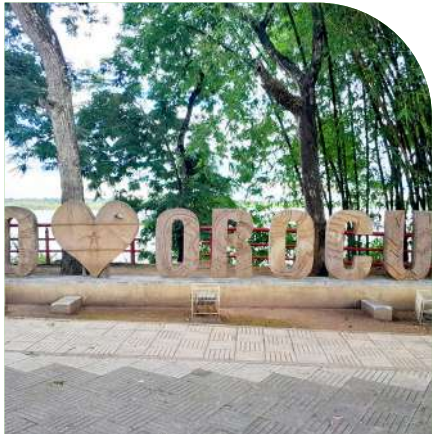
Plazoleta "Yo Amo a Orocué".