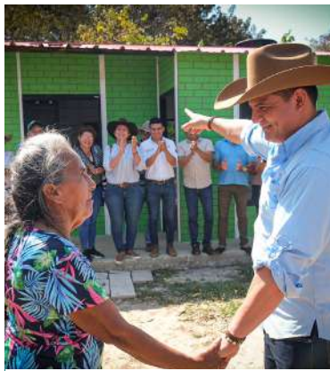
Promesas hechas realidad